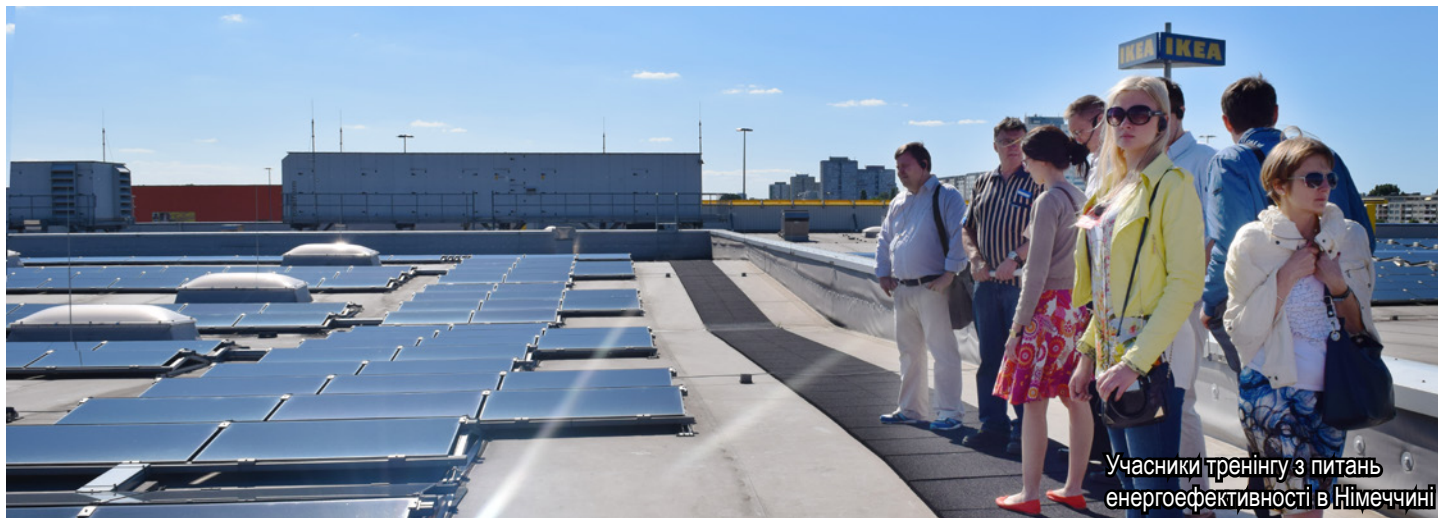
Учасники тренінгу з питань енергоефективності в Німеччині