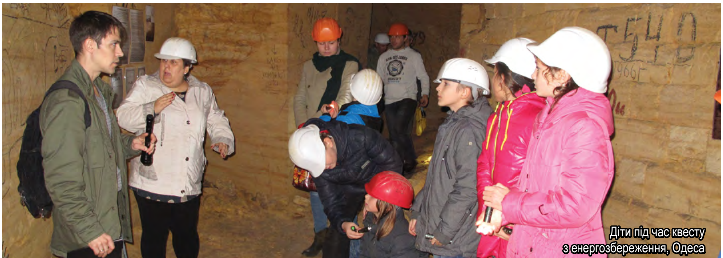
Діти під час квесту з енергозбереження, Одеса