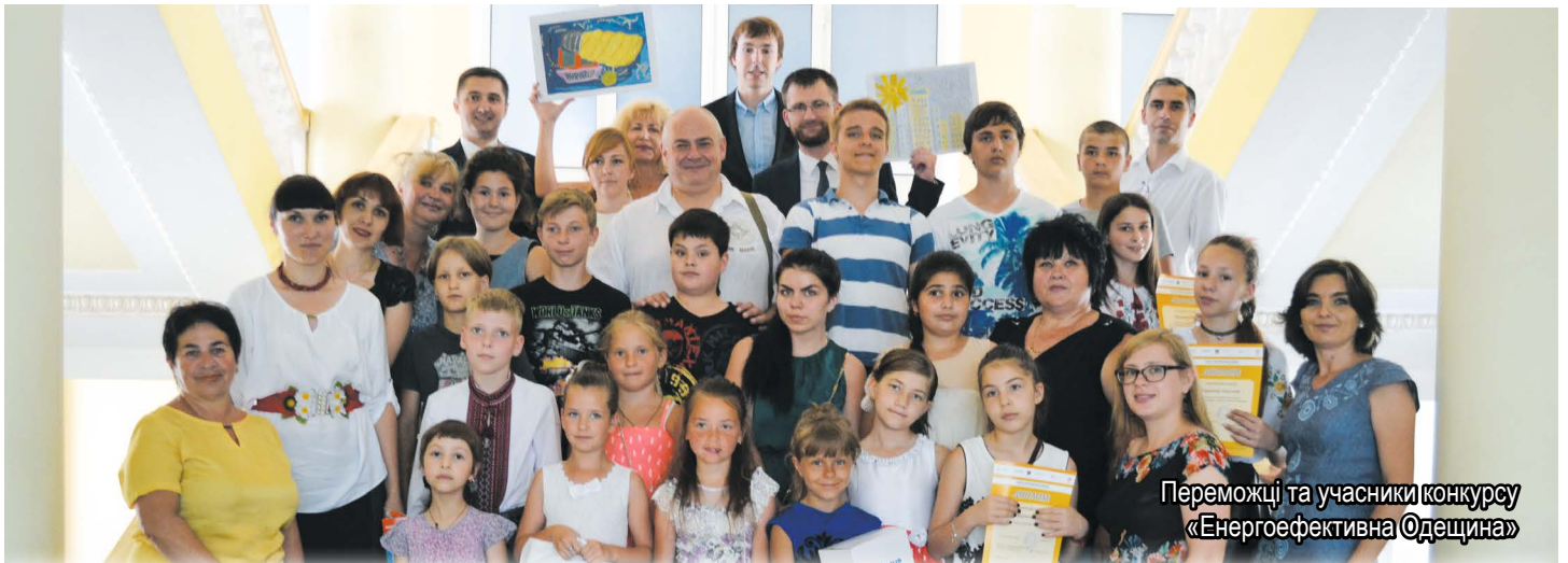
Переможці та учасники конкурсу «Енергоефективна Одещина»